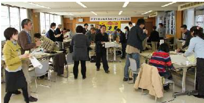
それぞれの意見をテーマごとに仕分けました

各テーブルの班の話し合いは、ワールドカフェ方式といって、途中で1回、メンバーを入れ替え、さらに話し合う方法で進めました。