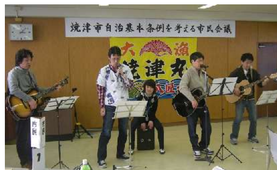
休憩時にはバンド演奏も

しかしまだまだ序盤。今後なるべくたくさんの焼津市にゆかりのある人と話し合いながら、本当につくって良かったと言える「焼津市のまちづくりの基本ルール」をつくり上げていきましょう。