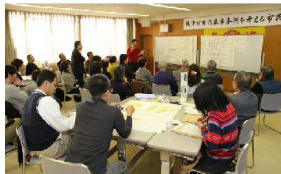
全体でまとめの話し合い

発行 焼津市自治基本条例を考える市民会議 事務局：焼津市企画財政部企画調整課 電話：054-626-2141（直通） E-mail：kikaku@city.yaizu.lg.jp