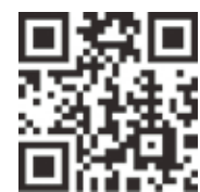
▲確定申告書等作成コーナー

確定申告書は、国税庁ホームページの「確定申告書作成コーナー」で作成することができます。また、マイナンバーカードと対応スマートフォンなどを持っている人は、スマートフォンから申告手続き（e-Tax）で送信することができます。