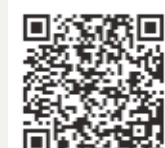
▲国税庁 LINE アカウント

※入場整理券は、会場で当日配布しますが、LINEアプリを使えば、事前にオンラインです。LINEアプリをインストールし、ホームの画面で「国税庁」と検索するか、左の二次元コードを読み取って、友だち登録してください。