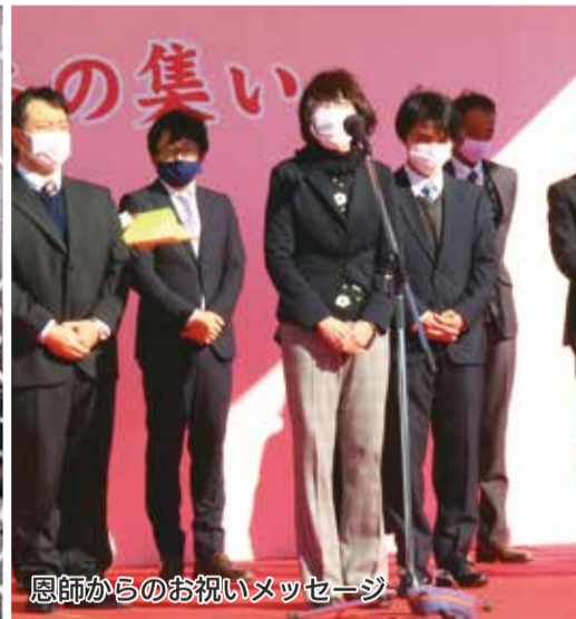
恩師からのお祝いメッセージ