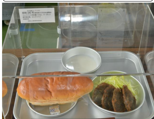
昭和26年頃の給食です