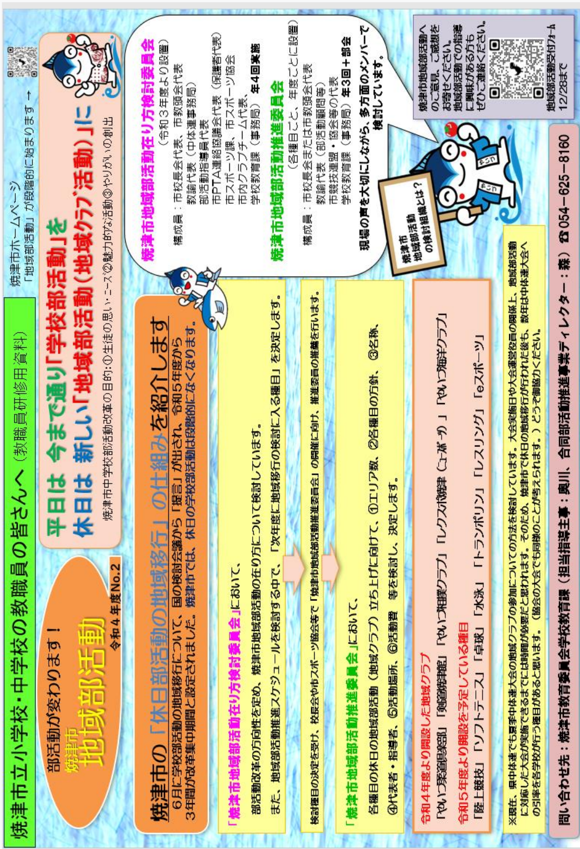
図2 教職員向けリーフレット