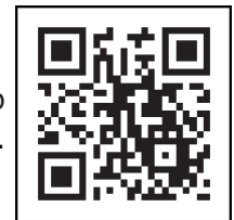
Código QR de navegación de la vacuna contra el coronavirus