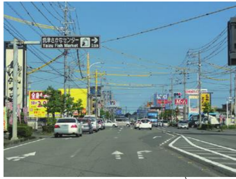
⑳焼津 IC 周辺