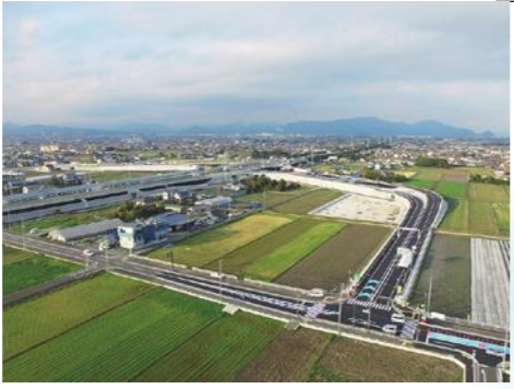
②大井川焼津藤枝スマート IC 周辺