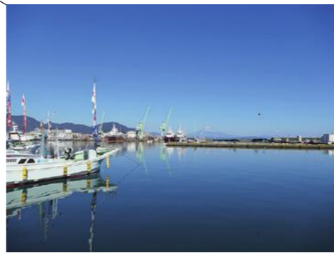
②焼津漁港（小川内港地区）