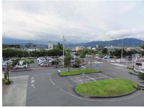
⑲ JR 西焼津駅周辺