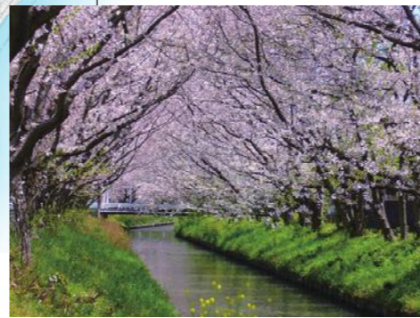
⑧すみれ台木屋川沿い桜並木周辺