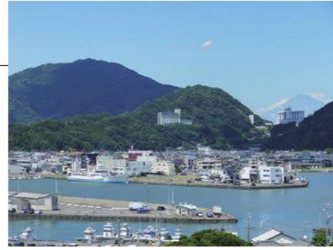
①焼津漁港（焼津内港地区）