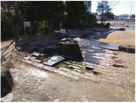
⑩大井川地域湧水地周辺