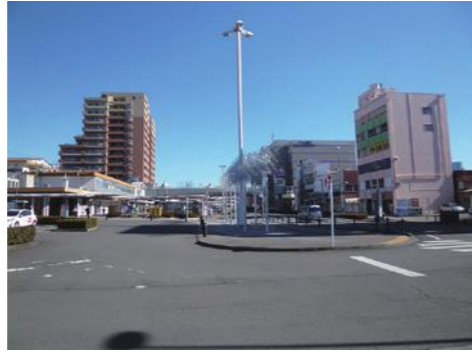
⑱ JR 焼津駅周辺