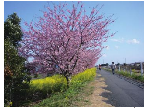
⑨朝比奈川堤山の手さくら周辺