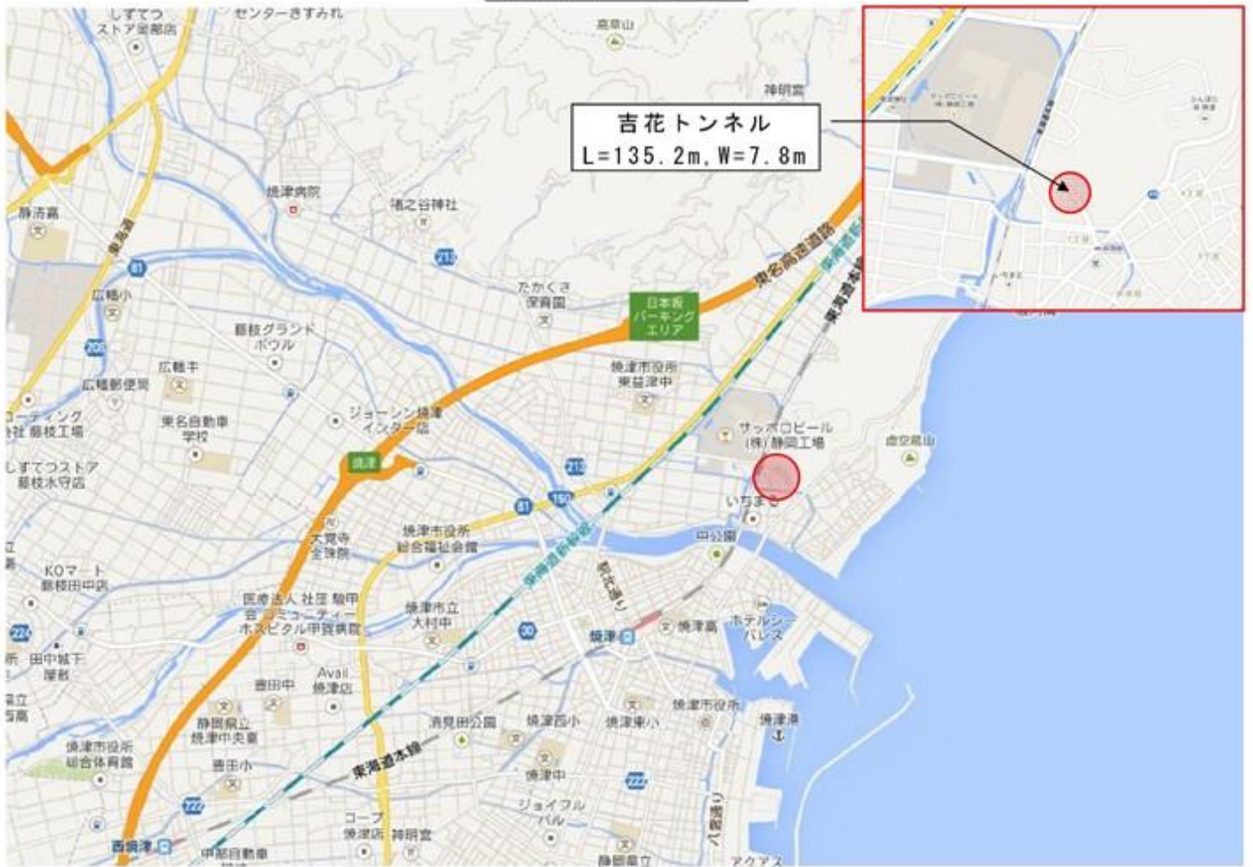
図 1.1 トンネル位置図