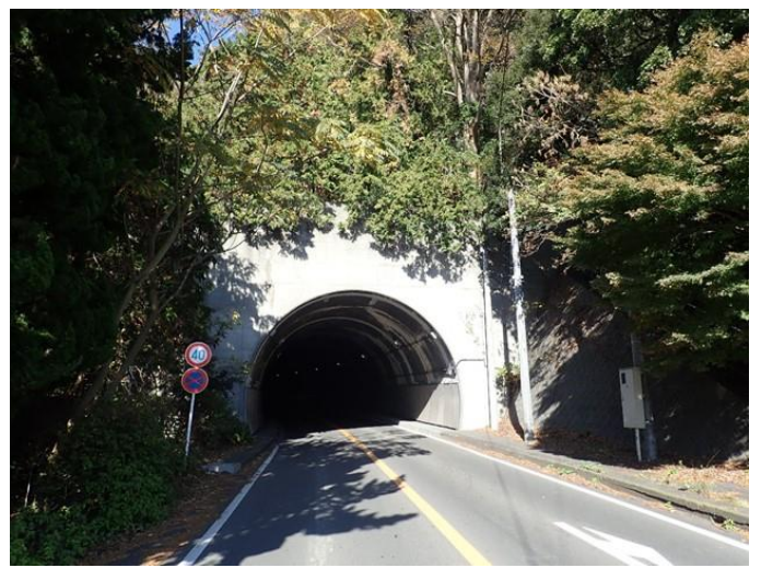
写真 1.2 南側坑口