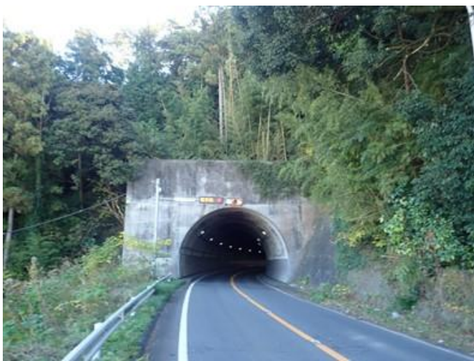
写真 1.1 北側坑口