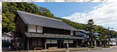
岡部宿大旅籠柏屋の見学