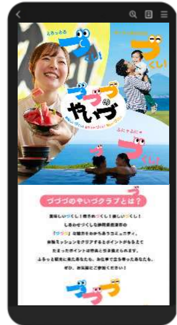
ファンクラブ 画面イメージ

取り組み内容 観光体験イベント参加や施設利用等によるポイント付与、ポイント交換でオリジナルグッズ等の特典進呈、ファン交流イベントの開催