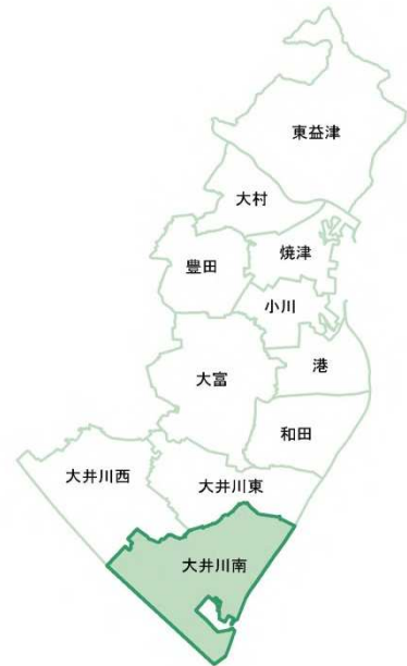
大井川南地域 位置

年齢3区分別人口割合は、15歳未満及び15歳～65歳未満が減少傾向に、65歳以上が増加傾向にあり、少子高齢化の傾向が年々強まっています。令和6年における65歳以上人口の割合は31.9%となっています。