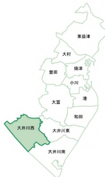
大井川西地域 位置

年齢 3 区分別人口割合は、15 歳未満及び 15 歳～65 歳未満が減少傾向に、65 歳以上が増加傾向にあり、少子高齢化の傾向が年々強まっています。令和 6 年における 65 歳以上人口の割合は 34.4%で、高齢化率は 3 番目に高い地域となっています。