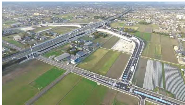
大井川焼津藤枝スマート IC 周辺