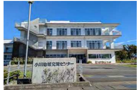
小川地域交流センター