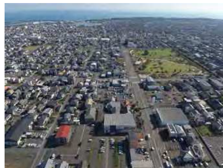
南部土地区画整理