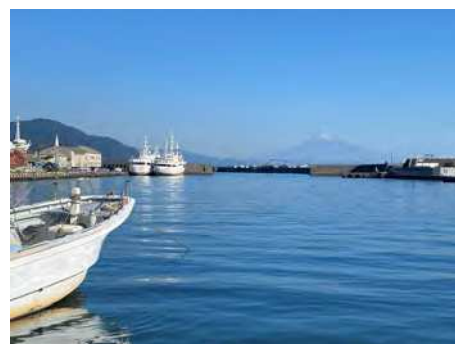
焼津漁港（小川地区）から富士山を望む景観