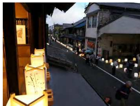
浜通りのあかり展