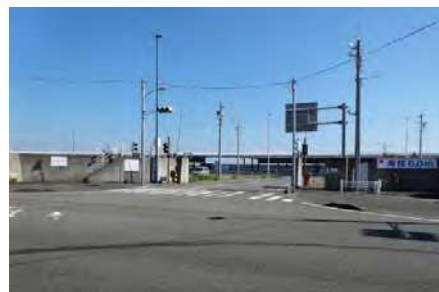
焼津漁港（新港地区）の陸間