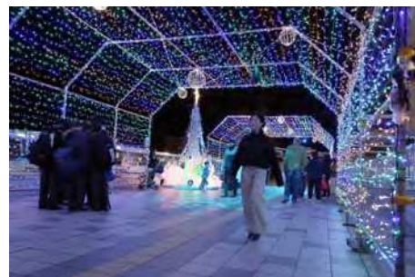
焼津駅周辺（焼津イルミネーション）