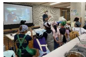
<黒はんぺんづくり>