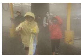
<超低温冷蔵庫体験>