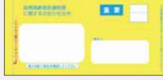
▲「黄色の封筒」で発送