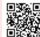
アプリ登録はこちら