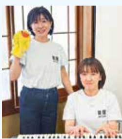
ECOa ♪ ECOka Instagram