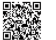
洪水ハザードマップ