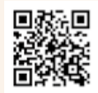
インターネット視聴はこちら