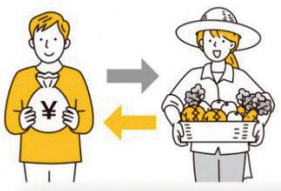
クラウドファンディング型ふるさと納税 (市HPより)