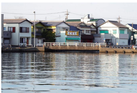
焼津漁港（小川港）に注ぐ前の川

A 焼津港、小川港、大井川港の三つの港は水産文化都市としての本市の発展にとって重要な施設であり、津波対策は大きな課題である。漁港・港湾施設を守ることが本市の産業を守り、ひいては市民の生命、財産を守ることにつながると認識している。焼津地区特定漁港漁場整備事業計画に構想として明記された港口水門については、引き続き事業化されるよう取り組む。また、大井川港については、物流生産拠点として機能強化と津波対策の胸壁整備を進める。