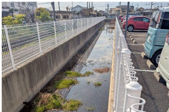
和田地域交流センター雨水貯留施設