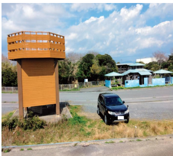
廃止の大井川河口野鳥園トイレ等

A 令和9年3月予定のクルーズ船初寄港をさらなる発展の契機と捉え港湾計画の見直しを進める。