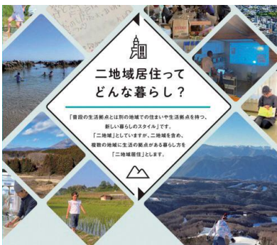
二地域居住とは (国土交通省ホームページより)

A 首都圏から人を呼ぶには全国と競合し、すぐに移住につながるにはハードルが高い。そこで関係人口施策、二地域居住施策を通じ焼津と関わりある方と関係性を深め、二地域居住者、更には潜在的な移住者として育成し、長期的視点で取り組んでいきたい。