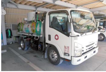
令和7年度焼津市し尿処理 事業特別会計補正予算（第 1号）案 増額1億2,577万2千円