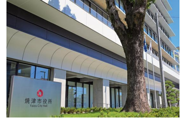
令和7年度焼津市一般会計 補正予算（第6号）案

増額1億7,699万5千円 子ども予防接種費、被災事 業者支援事業費（台風15号 関連）などの事業実施に必 要な経費の増額を行うもの