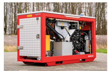
可搬式排水ポンプの取得に ついて

5,093万円 激甚化・頻発化する水災害 の被害から市民の生活を守 るため、取得するもの