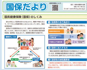
令和7年度焼津市国民健康 保険事業特別会計補正予算 （第2号）案 増額3,858万7千円