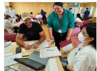
母語支援者は学習者の母語でコミュニケーションのお手伝いをします。

焼津市国際友好協会 Facebook の過去の投稿で、教室の様子をお知らせしています。ぜひご確認ください。