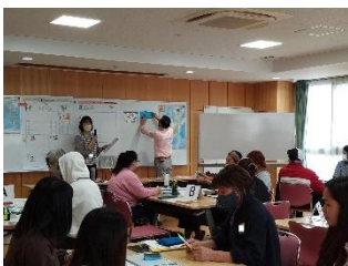
指導者は、学習者とサポーターが交流し学びあえるよう、教室を運営します。