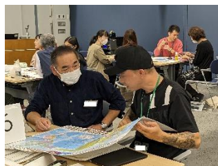
学習者とサポーターがペアやグループになり、対話活動を行います。わからない単語はホワイトボードに絵を描いたり、携帯電話で画像を見せたりして工夫をしながら意思疎通を図ります。指導補助者は教室を巡回し、サポートします。