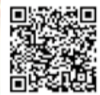
志太さくら 巡りマップ