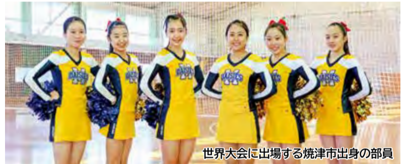
世界大会に出場する焼津市出身の部員

2008年焼津市生まれ(16歳)、藤枝明誠高校2年生。チアリーディング部に所属。昨年9月からキャプテンを務め、中学1年～高校2年生の部員30人を率いる。