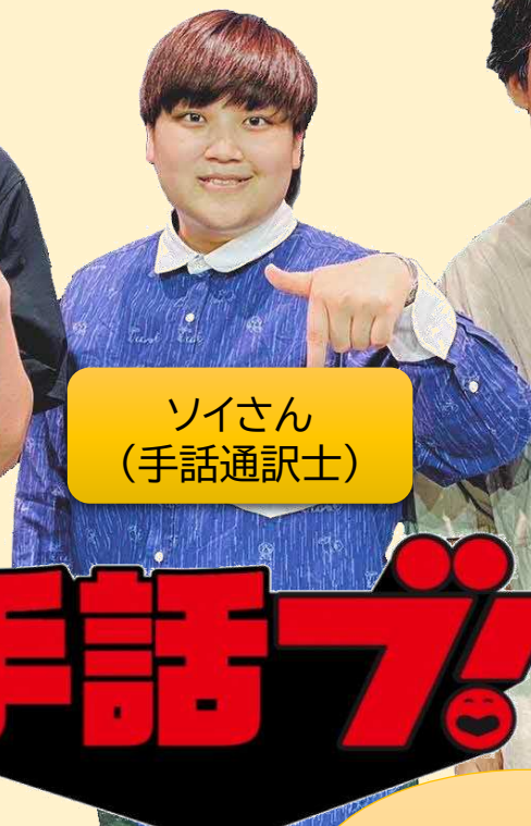
ソイさん (手話通訳士)