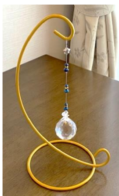
交流センターに 見本があります