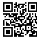
焼津おとな倶楽部

【対 象】市内在住働のおおむね50歳以上 【申込方法】焼津おとな倶楽部ホームページか、電話またはメールで申し込む。 【申込〆切】6月15日(月) 【問 合 先】焼津市生きがい・交流政策課 電話:631-6861 メール:shingenki@city.yaizu.lg.jp 【その 他】申込多数の場合は、会員を優先して抽選。