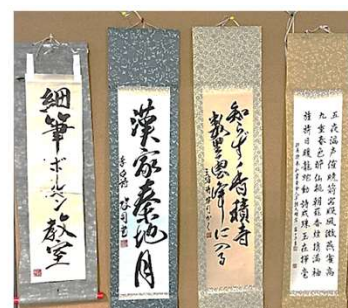
細筆ボールペン書道