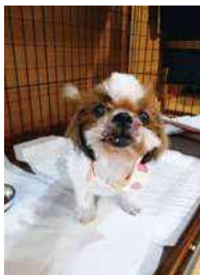
会から譲渡されていった犬

譲渡で人気があるのは子猫ですが、逆に大人の猫や病気や障害のある猫はなかなか譲渡先が見つからず、保護している間の医療費が掛かります。全く人馴れしていない猫のお世話をし、譲渡ができる状態にするために、ただ単純に保護しているだけ、という一言では表せないような大変さがあります。それでも譲渡した後に、譲渡先のご家族も猫も本当に幸せになっているのを見ることが、活動の原動力になっていると感じます。