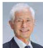
すぎた げんたろう 杉田源太郎 (日本共産党市議会議員団)