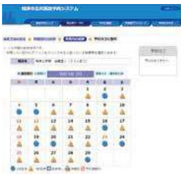
公共施設予約システムのPC画面

Q 今回のアプリ以外に構想は。 A 今後、マイナンバーを絡めて、個人を特定した電子申請、個人を特定して電子通知を送ることに取り組んでいきたい。