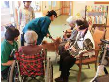
高齢者施設でのふれあい体験の様子（藤枝市岡部町）

※TNR活動とは、猫を捕獲し（トランプ）、不妊・去勢手術を施し（ニューター）、猫を生活していた元の地域へ戻した後（リターン）、寿命までその場所で過ごしてもらいう活動のことで、飼い主のいない猫の増加を防ぐことを目的とした地域猫活動です。不妊・去勢手術された猫は耳先がカットされています。