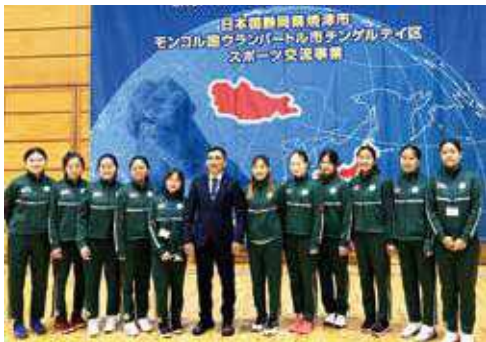
12月9日に来焼したチンゲルテイ区の中学生女子バレーボールチームの皆さん