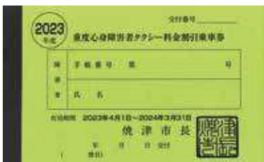
焼津市の重度心身障害者 タクシー料金割引乗車券