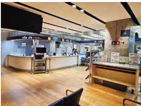
市役所本庁舎2階 市民課

A 市民課の日々の来客者数を確認しているが、大きな差は出ておらず、実感するまでには至っていない。