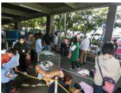
犬や猫の譲渡会の様子 イオン焼津店にて (表紙にも掲載しています)

また3月末頃まで昭和通り沿いにある焼津市市民活動交流センター「くるさく」でワンニャンの会の写真展示を行っていますので、お時間があれば、見に来ていただければと思います。