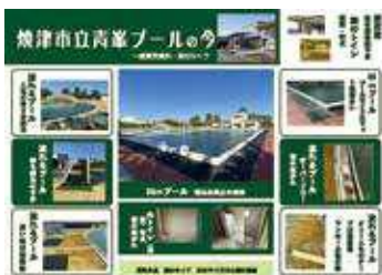
焼津市立青峯プール (2023年11月28日現在、 撮影・作成：深田)