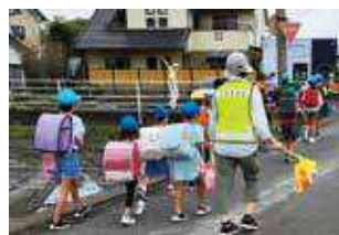
大井川東小の通学路の児童と見守り隊、R2年度追加の安全柵