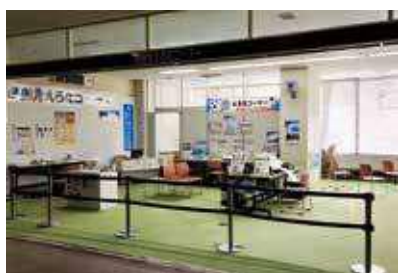
大井川庁舎 健康見える化コーナー

A 令和4年12月の開設から令和5年11月末までの利用人数は1645人となっている。市民の関心が高く、当初の利用は月100人としていたが、それを上回る利用状況となっている。