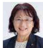
ふくだ ゆり子 深田ゆり子 (日本共産党市議会議員団)