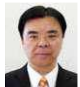
かわしま かなむら 川島 要 (公明党議員団)

A 気軽にセルフチェックできる認知症チェックシートを策定し、ホームページ掲載を検討する。