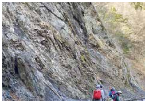
南アルプスの崖に見られるもろい地層 (2023年秋)

A 市民の心配事は捉えている。我々の使う水が枯渇することがなく確保できるよう、意見はしっかりと述べていきたい。