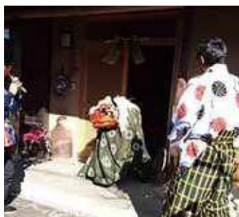
小川地区 正月の獅子舞

A 地域医療連携のさらなる推進を図るため地域の医療機関や介護施設などへの訪問活動を強化し、常に医療ニーズの把握に努めるとともに、医療と介護の連携を深めていく。