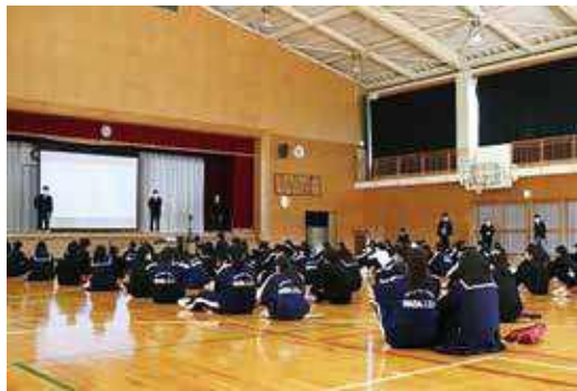
和田中学校体育館

A 文科省の補助、緊急防災・減災事業債などがあるが、早期着手という中で市の負担が少ないものを確認しながら進めていく。