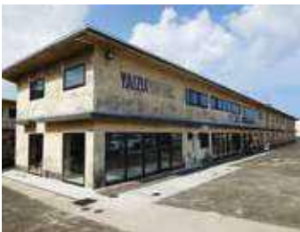
焼津内港地区の中核を担う 焼津PORTERS