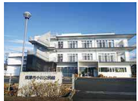
各地域の公民館が地域交流センターへ — 小川公民館 —

A 基本的には管理運営は今までどおり変更は無いが、祝休日が開館日となり、月曜日が固定で休館日となる（焼津地域交流センターは月曜日も開館）。