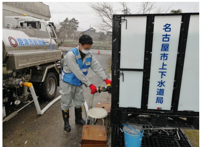
<給水車から仮設タンクに水を注水している様子>