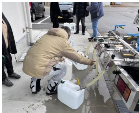
<給水車での給水の様子>

第1陣の活動期間である1月中旬は能登半島全体が断水状態にあり、給水車で給水ポイントへ水を運び、水ももらいにくる人達に配るという活動を行いました。住民の方が持参した給水袋やポリタンク、空のペットボトルなどへ、給水車に備わっている蛇口で水を注ぎます。