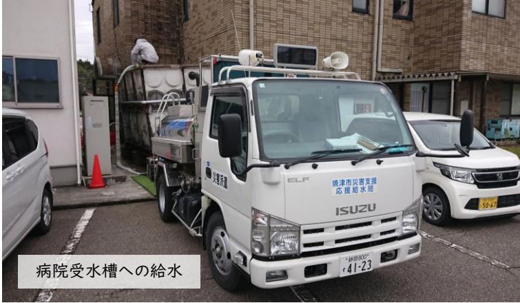
病院受水槽への給水

多くの病院や公共施設には受水槽があり、災害が発生してもすぐに断水しない所が多いですが、今回の地震のように断水が長くと受水槽の中の水がなくなってしまいます。病院で水が不足すると、手術や透析ができなくなるなど医療活動が停止してしまうため、病院は重要な給水施設です。