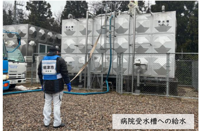
病院受水槽への給水