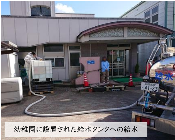
幼稚園に設置された給水タンクへの給水

焼津市水道事業が所有している給水車はタンクの容量が1,700リットルです。病院の大きな受水槽への給水活動では、1日に何度も注水ポイントと病院の間を往復してタンクを満水にします。特に大きな受水槽へは、他の市町から派遣された給水車と協力して対応しました。