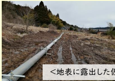
<地表に露出した仮設配管>