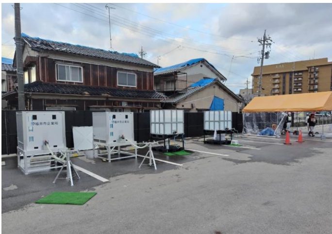
<給水所に設置された仮設タンク>

市民向けの給水所や避難所に設置された仮設タンクへ水を運びました。給水所によっては夜間の給水（無人）に対応しているところもあり、この仮設タンクを使うことで時間に関係なく給水所などでの給水が可能になります。