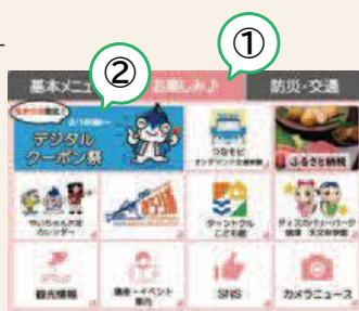
市公式LINEのメニュー画面