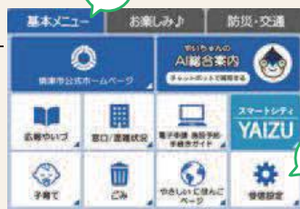
市公式LINEのメニュー画面