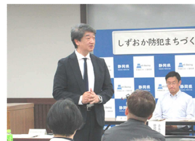
静岡県新聞販売連合会理事長御挨拶 (新規加入団体)

今年度新たに静岡県新聞販売連合会様加入了いただきました。 構成団体・機関数は112団体となりました。