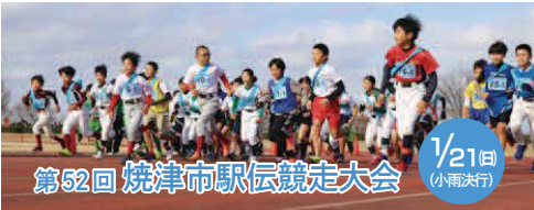
第52回 焼津市駅伝競走大会 1/21(日) (小雨決行)

大会には市内外からの参加に加え、スポーツ姉妹都市の土岐市のチームが参加するなど、総数136チームが出場します。応援よろしくをお願いします。 問合せ先 NPO 法人焼津市スポーツ協会 ☎626-7930