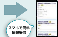
スマホで簡単情報提供