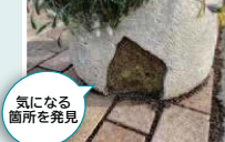
気になる箇所を発見