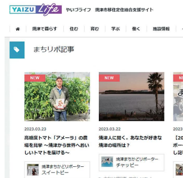
まちかどリポーターの記事 (WEBサイト「やいづライフ」より)

まちかどリポーターは行政だけでなく、市民と一緒に市の魅力を発信し、関係人口の増加や、市民による地域の自慢というような効果を考えている。 市公式HPは当初の構築から10年が経過しているため、市民の皆さまに、より情報が届きやすく、使いやすいようなリニューアルを考えている。