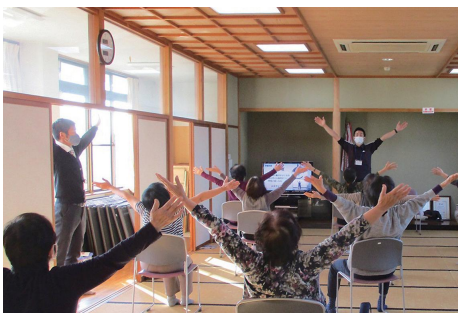
焼津ころばん体操の様子

A 元気なうちからの介護予防を充実するため、介護予防教室を増やすことや、焼津ころばん体操の普及啓発に力を入れていきたい。