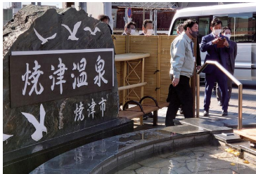
JR 焼津駅前の足湯施設

A 令和3年度に使用料金の改定を行っており、今後、事業者からの使用量収入の増加を見込んでいる。