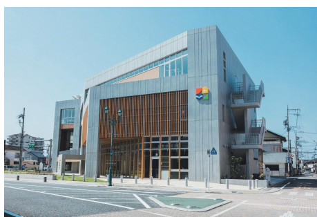
ターントクルこども館

りとして、和田公民館で木製おも ちゃに触れ合い、遊ぶ「木育キャ ラバン」を開催している。