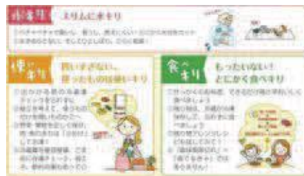
生ごみ処理の基本「3きり」 （焼津市ホームページで紹介）