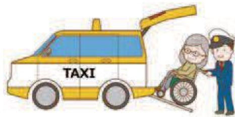
介護タクシー（イメージ）