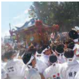
焼津神社大祭 荒祭の活気ある様子

A 文化財の保存や継承、活用などの具体策として、焼津市文化財保存活用地域計画を策定し、昨年12月に国の認定を受けた。本計画を進めていく中で、関係者の皆様とともに文化財の保存と活用に取り組みんでいく。