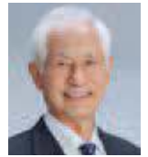
杉田源太郎 (日本共産党市議会議員団)