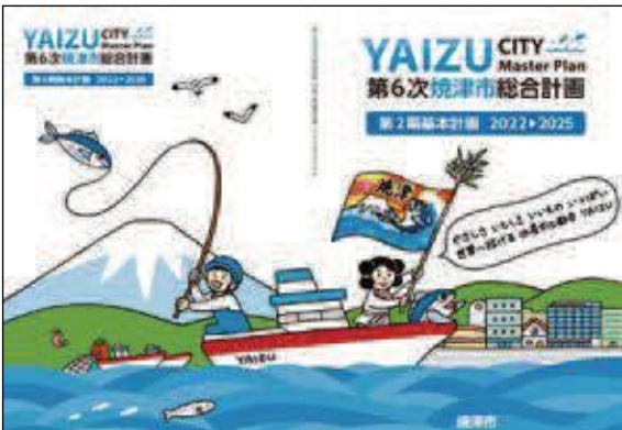
第6次総合計画第2期基本計画