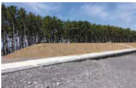
防潮堤と盛土 (利右衛門浜)

A 静岡県の交付金制度を活用し、収納設備のついた防災ベンチの整備を計画的に進めていく。