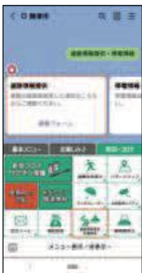
市公式LINEから通報できる

Q 道路の破損状況を収集する方法は。 A 市民や自治会、LINE、職員か らの通報や、道路課職員による道 路パトロールなどによる早期発見 に努めている。