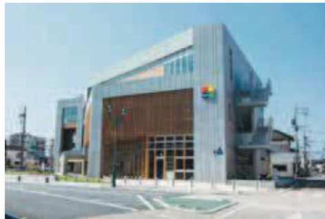
ターントクルこども館

りとして、和田公民館で木製おも ちゃに触れ合い、遊ぶ「木育キャ ラバン」を開催している。