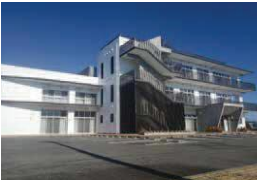
各地の公民館が地域交流センターへ — 小川公民館 —

さまざまな知識を学び楽しむ生きた拠点、地域の課題解決に向けた活動拠点の3つを柱とし、今後自治会等へ説明会を開催し、意見をふまえて基本方針をまとめ、条例制定後、令和6年4月より市内9公民館を地域交流センターへ移行する予定である。 Q 利用する際、運用は変わるのか。 A 自治会主催の地域行事に伴う懇親会、慰労会など一定のルールを守っていただいた中で飲酒も認める方向でも検討している。