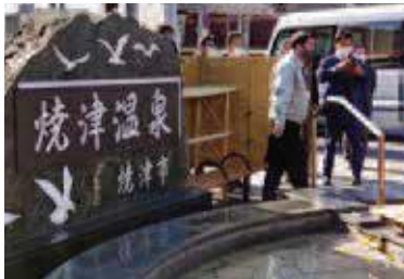
JR焼津駅前の足湯施設

A 令和3年度に使用料金の改定を行っており、今後、事業者からの使用量収入の増加を見込んでいる。