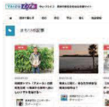
まちかどりポーターの記事 (WEBサイト「やいづライフ」より)

市公式HPは当初の構築から10年が経過しているため、市民の皆さまに、より情報が届きやすく、使いやすいようなリニューアルを考えている。