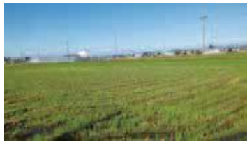
東名高速道路とつじ平団地間 約27ヘクタールの優良農地