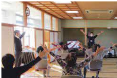
焼津ころばん体操の様子

A 元気なうちからの介護予防を充実するため、介護予防教室を増やすことや、焼津ころばん体操の普及啓発に力を入れていきたい。