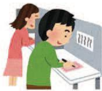
投票の様子 (イメージ)