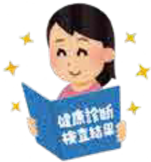
昨日がそうであったように 元気で自立して暮らせるように

A 結果を説明する機会がないため実施していない。担当課が検査結果から対象者を抽出し、保健師等の訪問で説明している。