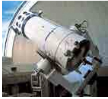
ディスカバリーパークの大型望遠鏡（県内最大）

大人になり、焼津に大型天体望遠鏡があるのを知り、木星とシューメーカー・レヴィ彗星の衝突の様子なども見せてもらい、やっぱり好きだったので、参加しました。