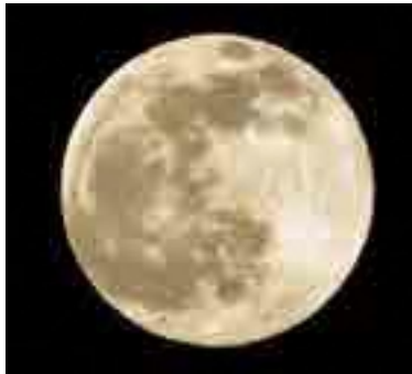
月のウサギ模様の理由は

ツルツとしていて、大きくて丸いという性質の玄武岩だったので、ウサギ模様はあんな風に見えます。知っていると、同じ月でもちよつと違いますよね。こんな風に、一歩踏み込んだ楽しみ方ができます。