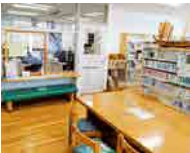
小川公民館図書室の様子