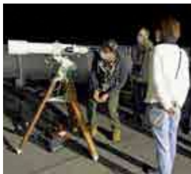
小型望遠鏡の操作を指導している様子

また、多くの方から人気の資格「星空案内人」の講座をディスカバリーパークが主催してくれるので、2年ほど勉強をして、知識を高める人もいます。