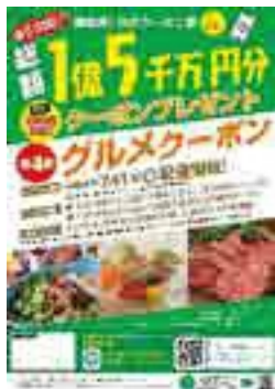
LINEクーポン祭 第4弾ポスター

A LINEクーポン祭第4弾では、1億円に五千万円を増額し、総額1億五千万円として補正予算を提案しているところである。