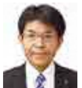
すずきひろみ 鈴木浩己 (公明党議員団)

Q 長引くコロナ禍に加えて、ロシアによるウクライナ侵略の影響が拍車を掛け、原油価格、物価高騰の中、生活者や事業者はさまざまな分野で大きな負担を強いられている。そうした中、国