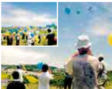
2013年、浜岡砂丘近くから高草山まで風船を飛ばした時の様子。