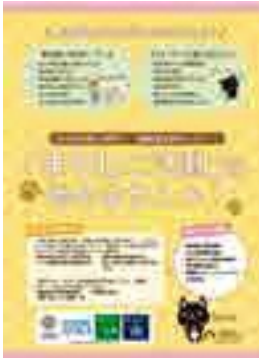
まちなこ活動を呼びかける京都市のパフレット

A 児童・生徒が気軽に相談できるように、心の教室相談員やスクールカウンセラーを配置し、定期的なアンケートを実施するなど対応している。