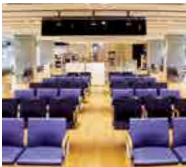
新庁舎2階 市民課ロビー

A 市民課の職員は本サービス利用者のサポートをする必要もあるため、本サービスの導入により職員数が減少するということはない。