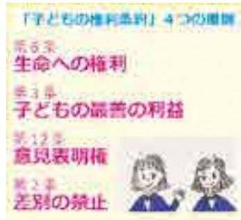
1989年に国連で採択され、1994年に日本で批准されている

A ①地元大富地区自治会から再設置の要望、市民意識調査やメールでも要望がある②当初予算措置はしていない③近隣の地域で公共用地の代替地を検討してきたが、面積や周辺道路等、諸条件に合わず見つかっていない。