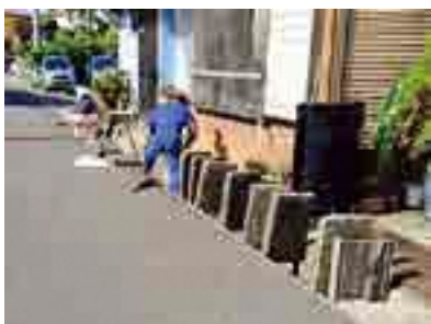
町内一斉の側溝清掃