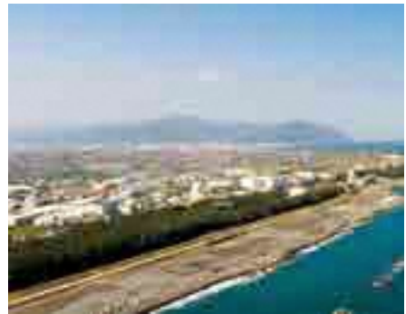
潮風グリーンウォーク