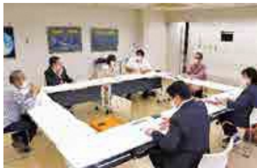
インタビューの様子 (ディスカバリーパーク焼津 天文科学館にて)

また、市内にどんなものがあるのかを、子どもたちにもっと教える機会があればと感じています。地域のお祭りや施設など、皆に知ってもらえれば、もっと盛り上がるんじゃないかと思っています。