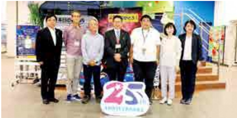
今回、インタビューに対応していただいたボランティアの皆さんと川島議員（写真左）、深田議員（写真右）