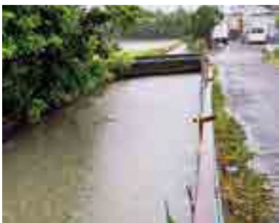
田尻新堀川の満潮時下流付近

Q 氾濫に際し、情報の収集や伝達はどうような手段で行うか。 A 同報無線、市ホームページ、やいづ防災メール、LINE、dボタンなどで情報発信をしている。