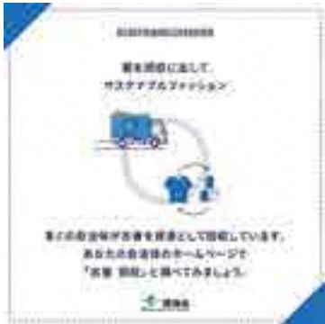
リユース古着の回収

A 環境省が推奨しているファッションと環境へのアクションとして5つの行動の意義を今後、市民の皆様にご講座などを通して理解をしてもらい、皆様にサステナブルファッションに取り組んでもらいたいと考えている。