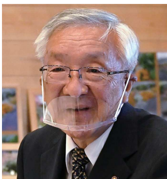
〈インタビュアー〉 岡田光正 議員