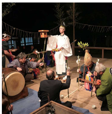
非公開で開催した藤守の田遊びの様子

伝統を絶えさせないため、コロナ禍の2年間でも、非公開で主な番組（演目）を続けることで、継承を図ることができたと思います。また、未婚の青年男子のうち、概ね26歳未満の若者に出てもらうのですが、3月10日以降は帰宅後に練習をします。時間の確保も大変なので、その辺りを理解してもらうことも重要です。