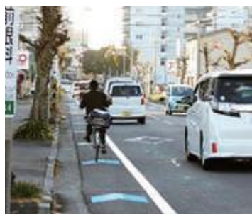
車道混在タイプの道路標示 (焼津駅北)

A 自転車利用が非常に多い焼津駅周辺を優先的に整備するエリアとし、中長期の計画として西焼津駅周辺等を位置づけ、車道混在タイプを主に整備を進める。安全かつ快適な走行空間には面的な整備が必須であるため、県等と連携を取りながら自転車ネットワークの形成を図っていく。