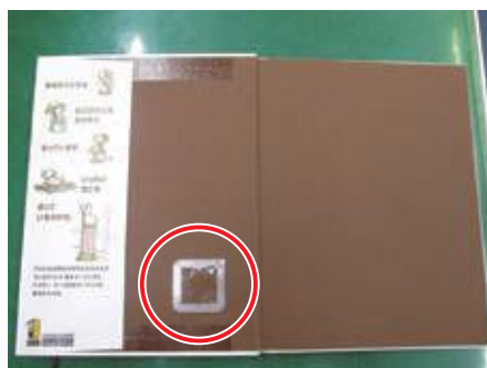
絵本に貼付されたICタグ

ただし、公民館の図書も図書館へ回送される場合があるため、公民館図書室の図書についてもICタグは付ける。