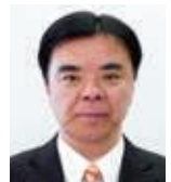
かわしま 川島 かなめ (公明党議員団)