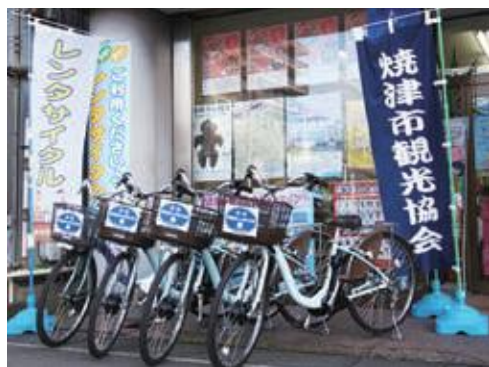
焼津市観光協会での人気の事業 ～レンタサイクル～