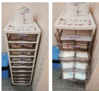
奈良県大和郡山市内の中学校トイレに設置された生理用品棚

A 各小・中学校では保健室に生理用品を常備し、必要な児童生徒に対応している。女子児童・生徒が保健室の養護教諭や女性教職員へ相談することで、心の籠った暖かな指導をすることができる。今後も児童・生徒に寄り添った対応を続けていく。