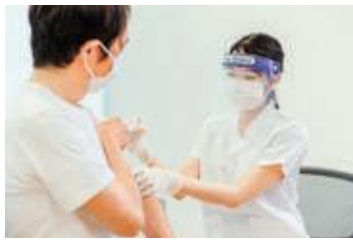
ワクチン接種 (イメージ)

A ワクチンの接種の希望者数については、高齢者となる65歳以上の方全てに接種の御案内をしている。今後の接種計画としては、64歳以下の方の接種券を、予約が混乱しないよう年齢を区切って7月以降に順次送付するとともに、安心して接種ができるかかりつけ医を中心とした体制でワクチン接種を進める。