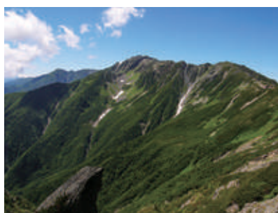
深緑の間ノ岳 (静岡市環境創造課)