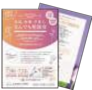
3月と7月に東京で開催 「女性による女性のための相談会」

A 市では受付方法や相談場所などプライバシーに配慮した体制を取っており、引き続き相談窓口の充実と情報提供に努める。