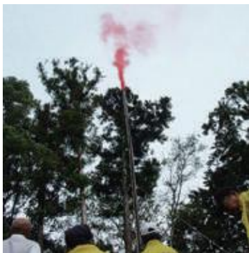
狼煙上げの様子 (方ノ上城址より)

『石灰を風車で送ったらどうなんだ』となつて、やってみたときには、落ちてきた石灰が目が痛くなつてしまったこともあります。