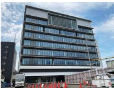
灯台をイメージしたという市役所新庁舎の北側からの外観

A 多くの手続きがワンフロアで決でき、窓口番号発券機を導入する。ご遺族が必要となる手続きをワンストップで行える支援コーナーも開設し、利便性や快適性が大きく向上する。展望ロビーのほか、随所に焼津らしさを感じるデザインとなっている。