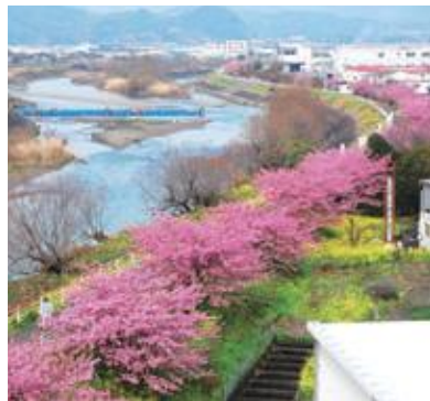
朝比奈川堤の山の手さくら

楽しんで活動した上で、皆さんも楽しめるようにしていった結果、人の流れが生まれ、焼津市の観光資源になった、あるいはなつていけば良いなと思っています。