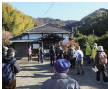
ふるさと探訪と繭梅の香りを聴く会の様子