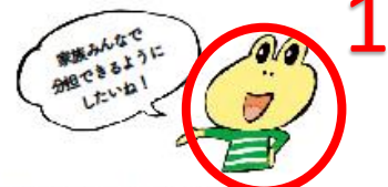
出典：新型コロナウイルスが女性に及ぼす影響について (静岡市女性会館による調査結果) 調査期間：2020年4月18日～27日

次のページでは、そんな課題を解決するヒントになればと「教えてカエルくん」の拡大版を特集します。