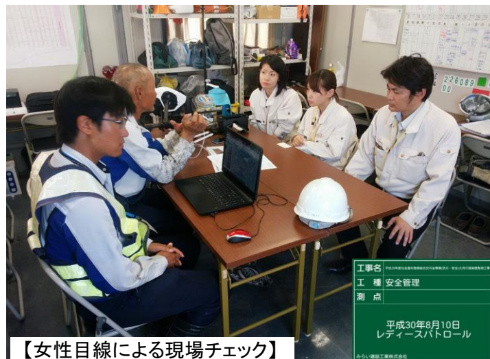
【女性目線による現場チェック】