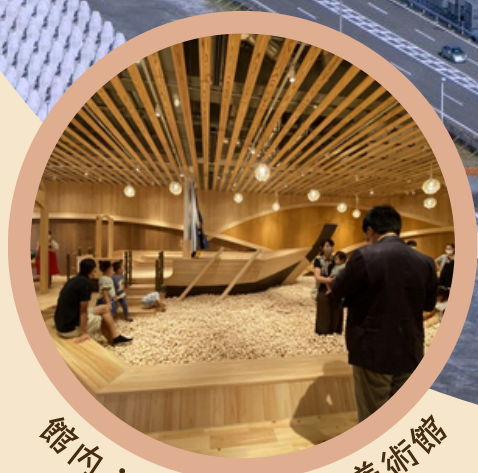
館内：焼津おもちゃ美術館