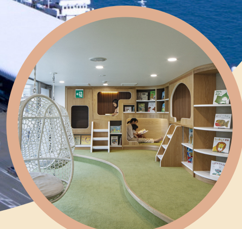
館内：焼津えほんこ