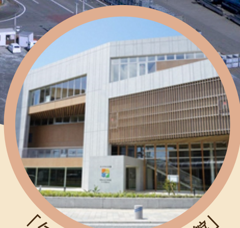
「ターントクルこども館」