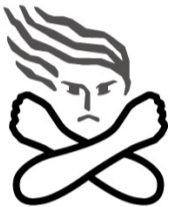
女性に対する暴力 根絶のための シンボルマーク

DV(ドメスティック・バイオレンス)という言葉はご存じですか?夫婦や恋人など、親密な関係にある(あった)者から振るわれる暴力がDVです。「暴力」と聞くと、殴る・けるなどの「身体的暴力」だけと考えがちですが、DV防止法が禁止する「暴力」には、暴言を吐く、無視するなどの「精神的暴力」、生活費を渡さないなどの「経済的暴力」、家の外に出さないなどの「社会的隔離」、性行為を強要するなどの「性的暴力」なども含まれます。DVは、基本的人権を脅かす犯罪行為です。毎年11月12日から25日は、「女性に対する暴力をなくす運動週間」です。これを機に自分や周囲の人の言動を振り返ってみましょう。