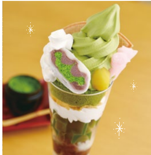
雅正庵鞠福パフェ850円(税込)