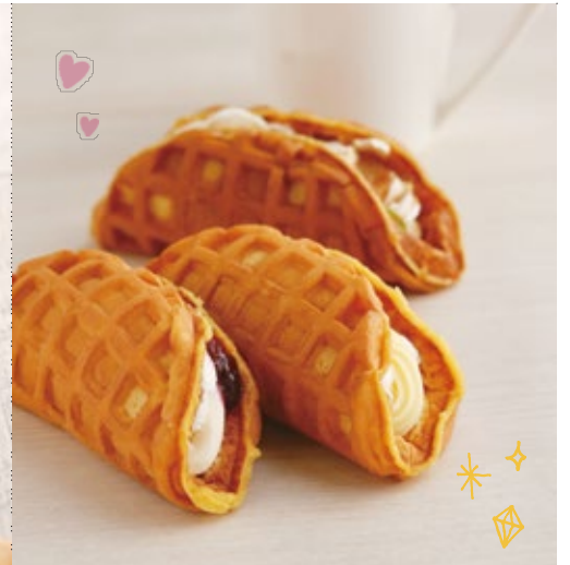
BBチーズ180円、カスタード160円、わらびもち180円(全て税込)