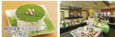
静岡抹茶ティラミス 700円(税込)

賑わいを見せる店内は、学生からご年配の方まで様々なお客様でいっぱい。静岡産の抹茶をふんだんに使った和洋スイーツはどれも絶品。中でも不動の人気を誇るの、開店当時から愛される鞠福パフェ。新メニューも次々に出るので、何度訪れても楽しめます。