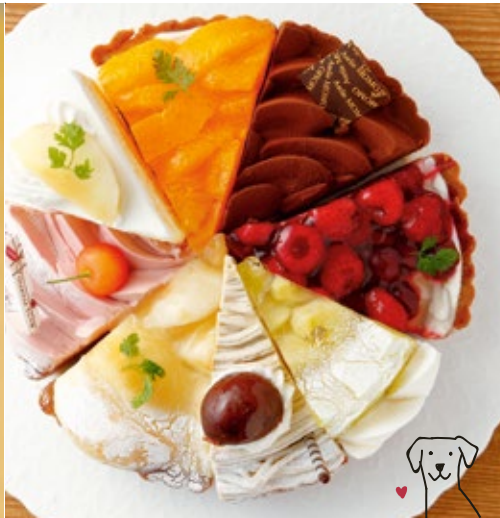
タルトケーキ8種(各400~600円)(税込)