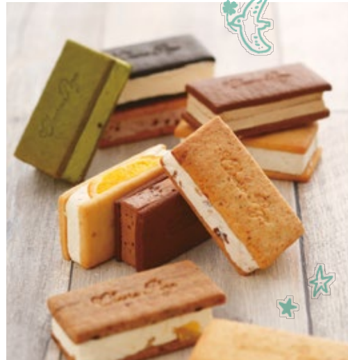
クッキーチーズサンド10種(各320円~480円)(税込)