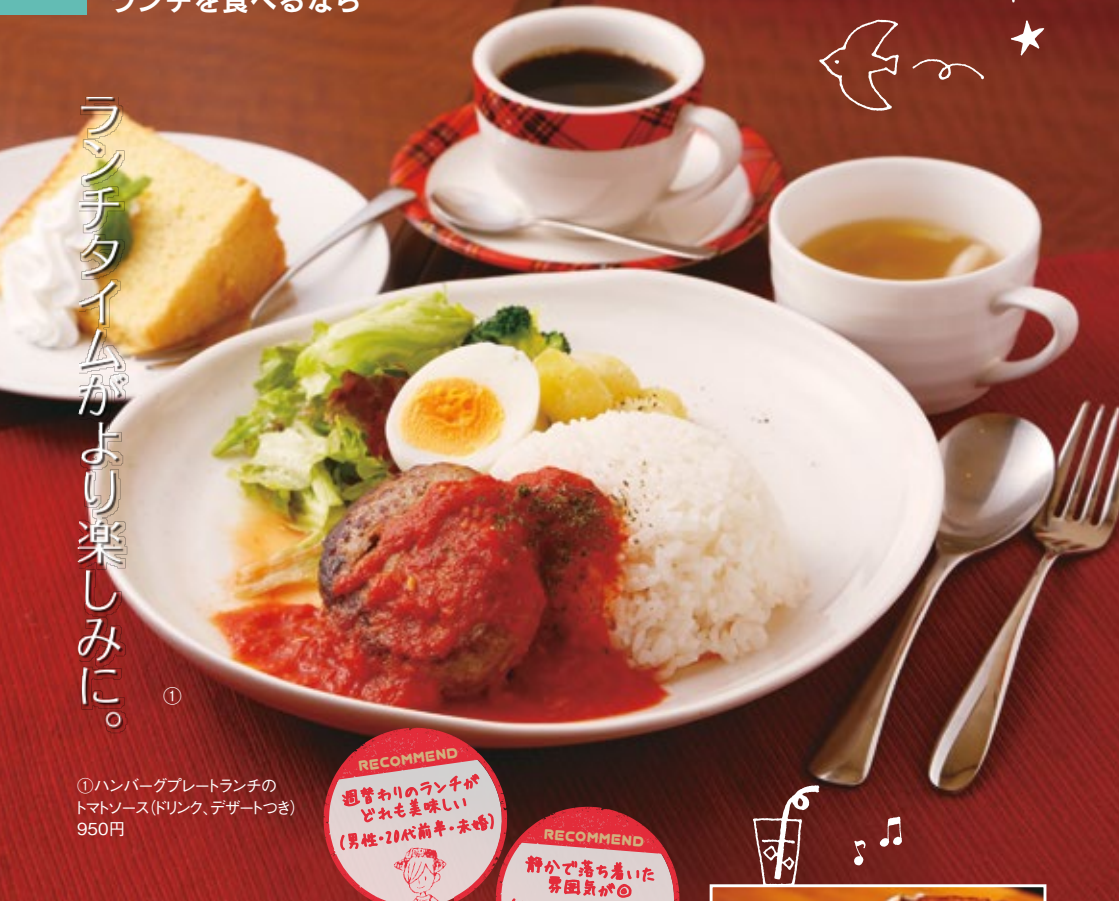
①ハンバーグプレートランチのトマトソース(ドリンク、デザートつき) 950円

RECOMMEND 週替わりのランチがどれも美味しい (男性・20代前半・未婚)