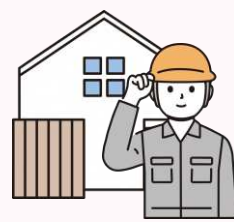
住宅のリフォーム 増築