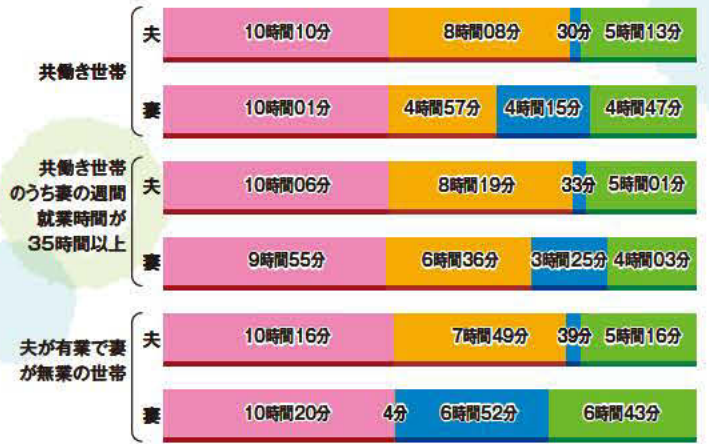
■睡眠・食事等 ■仕事・通勤等 ■家事・育児・介護等 ■自由時間(3次活動時間) 参考:総務省「社会生活基本調査」(平成18年)より作成。

男性の家事・育児・介護等に関する時間は、妻の就業状況に関わらず30分程度と非常に短くなっています。