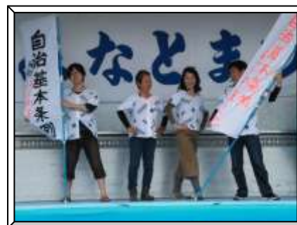
◆うおコレでポーズを決めてPR◆

また、会場内のイベントステージで開催された「うおコレ(魚河岸シャツファッションショー)&ご当地ユニフォームショー」に出場して、市民会議で作成したオリジナルの「自治基本条例魚河岸シャツ」と手作り「幟旗」によるPRも行い、たくさんの方に、私たちの取り組みと『自治基本条例』について知っていただくことができました。