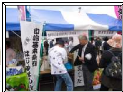
◆ブースで啓発グッズを配布◆