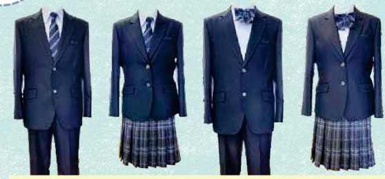
【上】ブレザー(ゆったり・細身) Yシャツ/ポロシャツ ネクタイ/リボン 【下】スラックス(ゆったり・細身) スカート

先生: 今年にニーズがあったんだと感じた。生徒は柔軟に対応してくれており、自分で選択できるようになってよかった。 先生: 生活の上で「個性を認め合う」ということを小中学校で教えてきている。高校でも、しっかりやっていきたい。