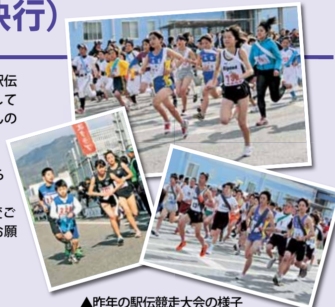
▲昨年の駅伝競走大会の様子

参加チーム数 278チーム 開会式 午前11時30分～ 焼津漁港新港 スタート時間 ●10.9kmコース…正午 ●20.2kmコース…午後0時10分 閉会式 午後2時～ 市役所本館前ふれあい通り ※雨天の場合は市議会庁舎3階308号室。