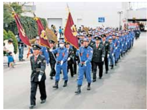
▲昨年の分列行進の様子