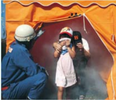
▲昨年の東益津第15自主防災会の防災訓練の様子