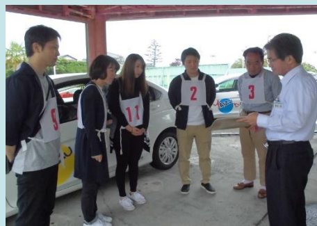
セーフティドライバーコンテスト