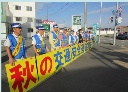
交通安全運動期間中の取り組み