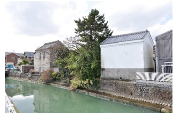
堀川沿いに残る蔵の様子