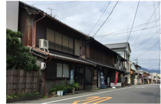
浜通りに残る伝統的の建物の様子