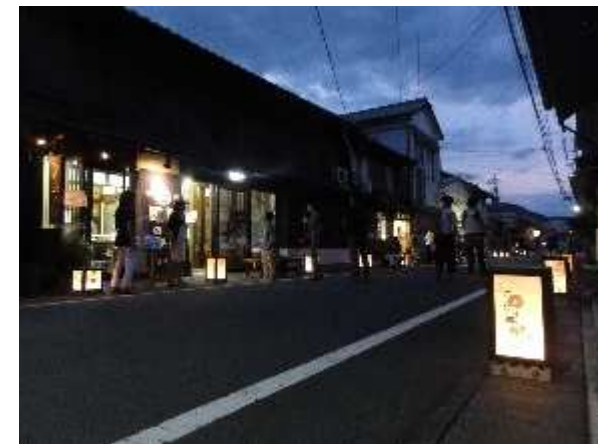
③まちの魅力や活力の創出