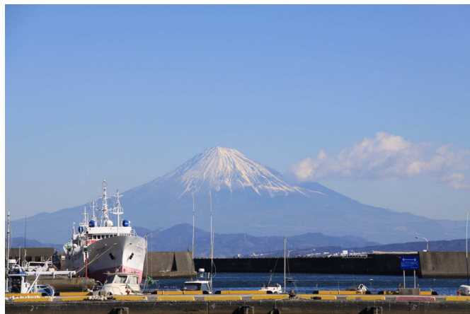
①地域への誇りや愛着の醸成