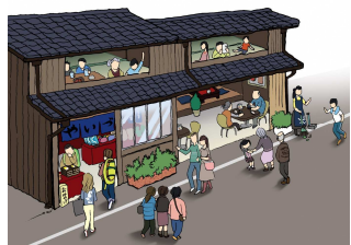
服部家改修イメージ