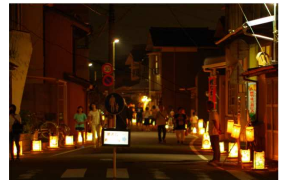
やいづ浜通り 夏のあかり展の様子