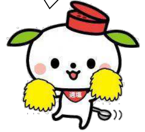
島田市「ヘルしろう」