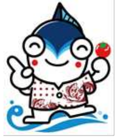
焼津市「やいちゃん」